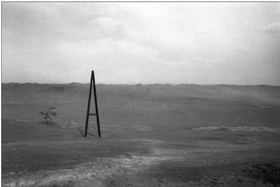
Kosovo, © Klavdij Sluban

Pour toute information, si vous désirez nous contacter :