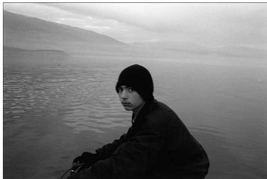
Grèce du Nord, © Klavdij Sluban