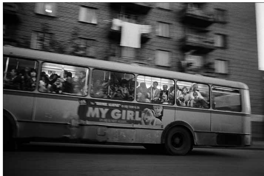
Albanie, © Klavdij Sluban

Ce programme a été conçu en prenant en compte tous les aspects qui permettront de rendre ce workshop aussi agréable qu'efficace et instructif (logistique, technique, matériel...). Cependant, il se peut toujours qu'un programme même soigneusement préparé se trouve sujet à de légers changements en fonction de la situation au moment du workshop même. Dans ce cas, vous serez bien sûr informés au plus tôt. Très hautement recommandé: faire toutes les réservations de transport remboursables.