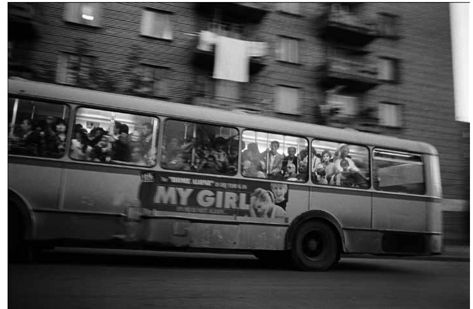
Albanie, © Klavdij Sluban

Ce programme a été conçu en prenant en compte tous les aspects qui permettront de rendre ce workshop aussi agréable qu'efficace et instructif (logistique, technique, matériel...). Cependant, il se peut toujours qu'un programme même soigneusement préparé se trouve sujet à de légers changements en fonction de la situation au moment du workshop même. Dans ce cas, vous serez bien sûr informés au plus tôt.